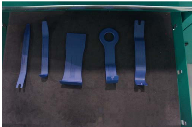
9、工具车第四层摆放照片