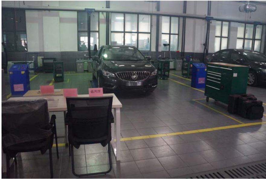
图 1 车辆下方设有小剪举升机的工位

由于比赛现场布置 15 个比赛工位，主要分两种工位布置方式。一种如图 1，车辆下方设有小剪举升机，即原有的定期维护比赛工位；另一种如图 2，车辆下方没有设置小剪举升机（诊断项目比赛时，不使用剪式举升机）。