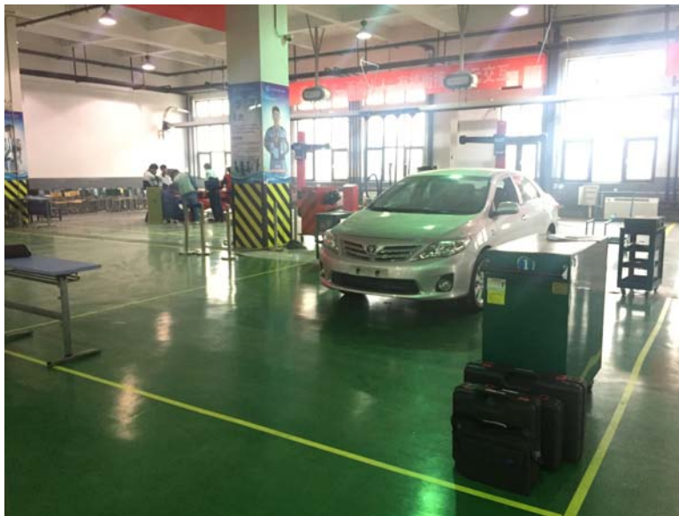
图 2 车辆下方无小剪举升机的工位