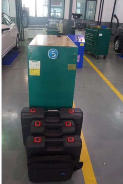
6、工具车第一层摆放照片